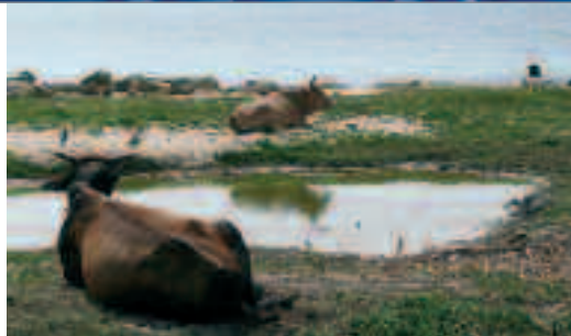
Les leptospires peuvent contaminer l'environnement.

Loin de se limiter au réservoir animal, les leptospires contaminent également l'environnement, en particulier en milieu tropical. Les animaux d'élevage atteints par la maladie participent à son ensemencement en urinant dans les milieux naturels. Prés humides, bords de rivières à faible courant, bords de mare, eaux