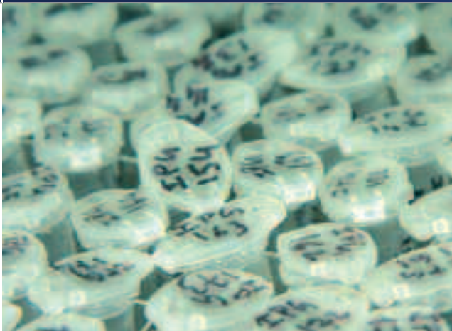
Stock de moustiques à disséquer.

une tendance mondiale particulièrement marquée dans la région Amérique », souligne le docteur Laurence Marrama. L'apparition de nouvelles zones pavillonnaires associant présence d'eau et forte densité humaine offrent des conditions idéales pour la survie du moustique et pour la transmission de la