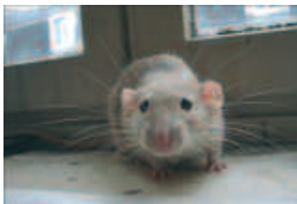
Les rongeurs peuvent être porteurs de leptospires.

Endémique dans la zone intertropicale, la leptospirose survient toute l'année sous des climats chauds et humides. Dans les pays tempérés, on ne la retrouve généralement qu'à la fin de l'été, car la bactérie ne survit pas dans un environnement soumis aux basses températures de l'hiver. Comment se transmet la leptospirose ? Des animaux à l'homme. Tous les mammifères peuvent être porteurs de leptospires,